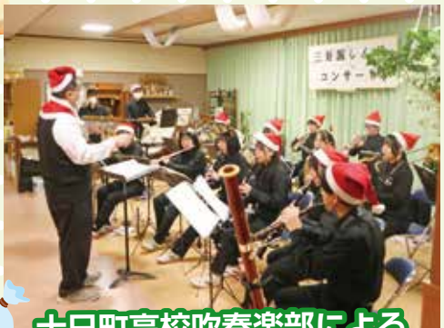
十日町高校吹奏楽部による「クリスマスコンサート」