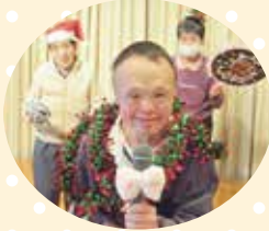
十八番の「雪国」に会場は 酔いしれました♡