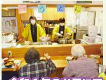
令和6年のお昼にて

お昼に食券を配り、お店のような感じでうどんを召し上げて頂きました。いつもと違う雰囲気「お店に来たみたい」と喜ばれてました。