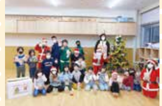
クリスマス会はビンゴで 楽しみました♪