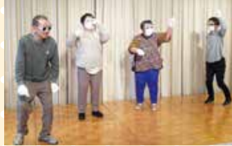
練習は恥ずかしかったけど… 「私が主役！」

生活介護・就労B型事業所では4年振りの「X'mas・忘年会」総勢40名で二葉家様を会場に盛り上げました。ご利用者全員が笑顔あふれる素敵な催しとなりました。