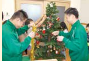
ツリーのオーナメント付けや 片付けも一緒に行いました