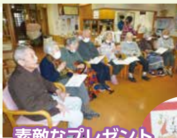
素敵なプレゼントも頂きました

北越こども園とリモートで交流会を行いました。踊りや和太鼓の演奏の披露があり皆さん手拍子をしながら楽しめました。