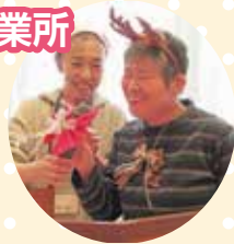
職員と息ぴったりの 司会でした